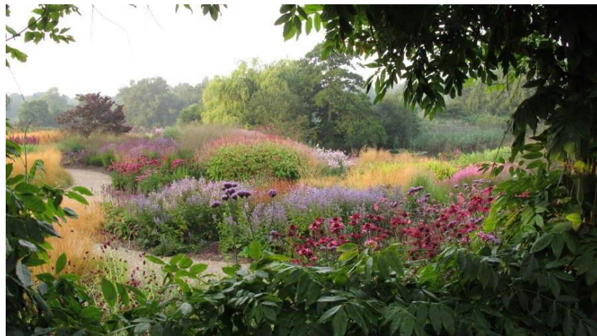
Cinco estaciones. Los jardines de Piet Oudolf. Thomas Piper