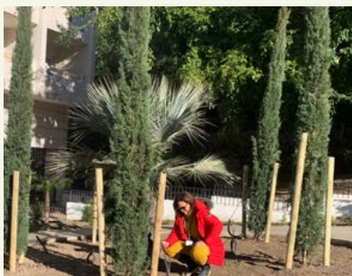
▲ Imagen 14, 15, 16 y 17. ‘El Jardín de los Sentidos’. Instalación del sistema eléctrico bajo el sendero. Ensanche de taludes y aporte de materia orgánica: enmienda del sustrato. Senderos de hormigón impreso con iluminación integrada. Posicionamiento final de focos de 2700 grados Kelvin.