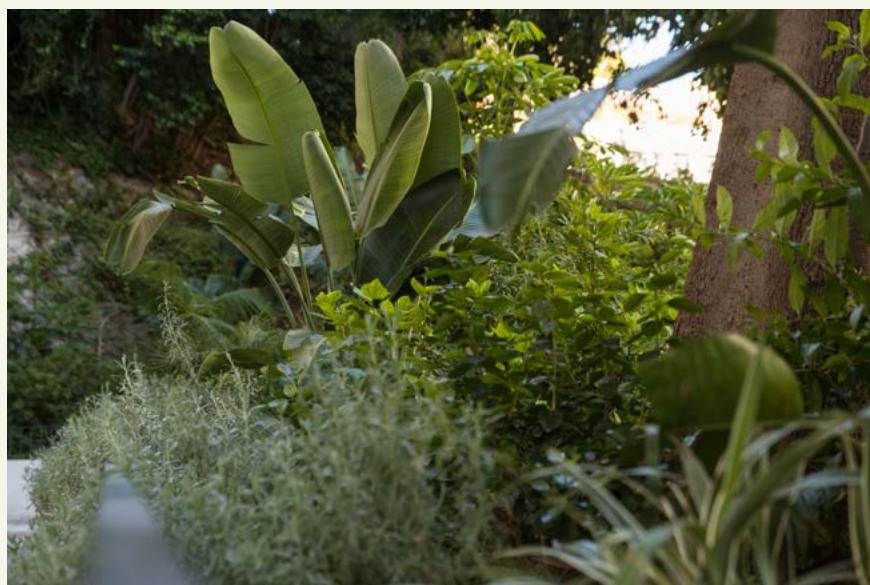
▲ Imagen 9. ‘El Jardín de los Sentidos’. El aroma y colorido grisáceo de la Lavandula dentata enmarca las tropicales Strelitzia augusta, Dianella tasmanica e Hibiscus rosa-sinensis.

‘El Jardín de los Sentidos’ es un espacio verde especialmente diseñado para estimular los sentidos y fomentar la interacción entre las personas, las plantas y la naturaleza.