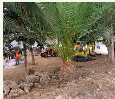
▲ Imagen 11, 12 y 13. ‘El Jardín de los Sentidos’. Limpieza del terreno. Demolición de antiguas aceras y muros perimetrales. Traslantes.