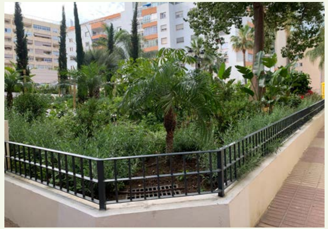
▲ Imagen 26. ‘El Jardín de los Sentidos’. Zona sur. Después de las obras.

ma de acumulación de agua en la parte norte del parque, y aunque se mejoró el sistema de drenaje, aún quedó un área húmeda y sombría, que resultó ideal para la creación de un jardín tropical.