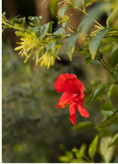
▲ Imagen 20. 'El Jardín de los Sentidos'. Hibiscus rosa-sinensis y Cestrum nocturnum . Color y aroma típicos de Marbella.