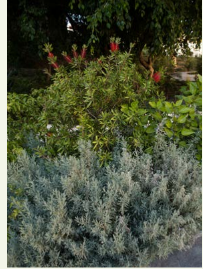
▲ Imagen 21. 'El Jardín de los Sentidos'. Contraste cromático entre el gris de Lavandula dentata y las inflorescencias rojas de Callistemon citrinus 'Splendens'.