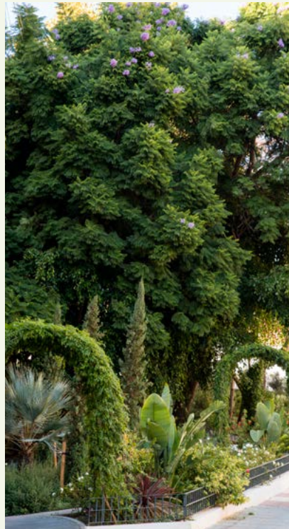
▲ Imagen 4. 'El Jardín de los Sentidos'.

Jacaranda en flor; especie vegetal que genera SSEE de regulación, pues gracias a su gran copa absorbe una cantidad considerable de CO 2 , y SSEE culturales, por su belleza escénica.