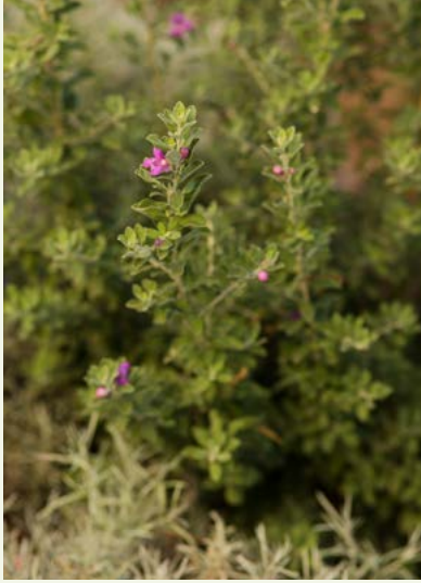
▲ Imagen 19. 'El Jardín de los Sentidos'. Leucophyllum frutescens , una excelente planta para atraer a polinizadores que resiste muy bien a la sequía, y cuyo follaje color grisáceo embellece el jardín.