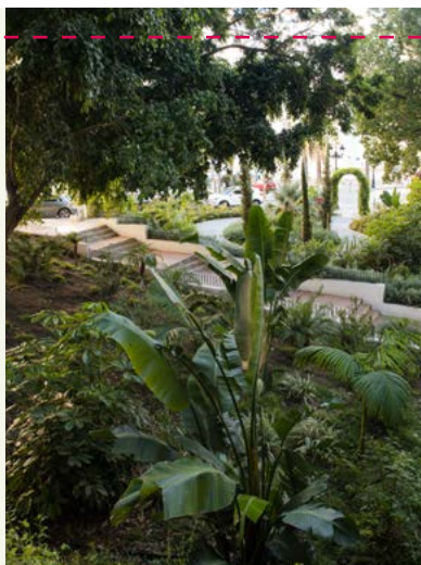
▲ Imagen 7. ‘El Jardín de los Sentidos’. Visión cenital del parque.