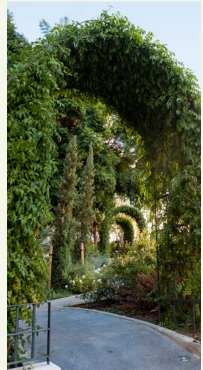
▲ Imagen 5. 'El Jardín de los Sentidos'.

Jacaranda en flor.