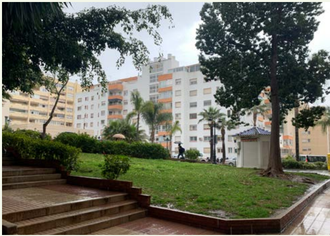
▲ Imagen 25. ‘El Jardín de los Sentidos’. Zona sur. Antes de las obras.