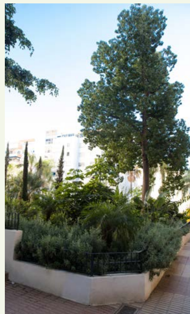
▲ Imagen 18. ‘El Jardín de los Sentidos’. Lateral zona sur con Brachyichiton populneus .

Las obras se llevaron a cabo en dos fases: