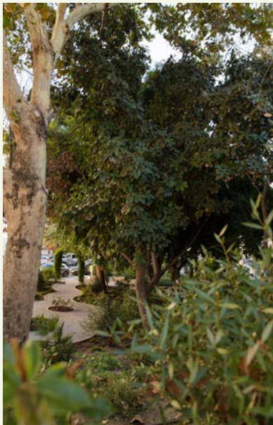
▲ Imagen 6. ‘El Jardín de los Sentidos’. Vista del sendero de la zona norte.